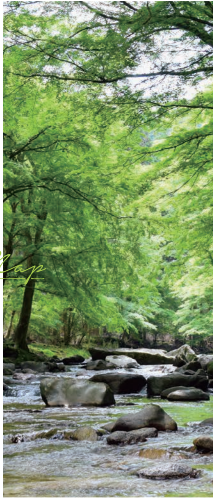
新城市観光案内情報誌